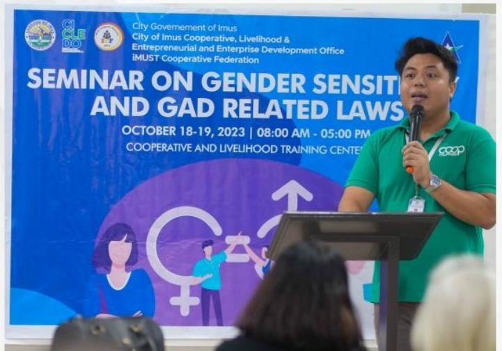
Gender Sensitivity and GAD-Related Laws Seminar

Napag-usapan din ang mga batas na nagsusulong sa pantay-pantay na karapatan, anuman ang kasarian ng isang tao. Ilan sa mga ito ay ang Magna Carta of Women o Republic Act (RA) No. 9710, Anti-Violence Against Women and Children Act of 2004 o RA 9262, at Anti-Sexual Harassment Act of 1995 o RA 7877.