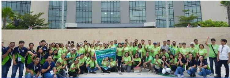
COOP Unity Walk

IMUS, Cavite — Ipinagdiwang ng City of Imus Cooperative, Livelihood & Entrepreneurial and Enterprise Development Office (CICLEDO) ang Imus Cooperative Week 2023, kasabay ng National Cooperative Month ngayong Oktubre, mula nitong Oktubre 16–20, 2023.